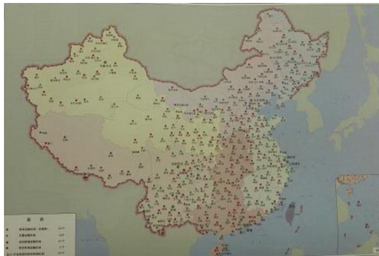
รูปที่ 2 แผนผังการก่อสร้างสนามบินเพื่อการขนส่งสินค้าในอนาคต

สนามบินอยู่ระหว่างการก่อสร้าง 28 แห่ง เพิ่มขึ้นอีก 163 แห่ง สนามบินขนส่งสินค้าเฉพาะ 11 แห่ง พัฒนาความเป็นเมือง ความเป็นเมืองในรูปแบบใหม่ ร้อยละ 60 ของ ประชากรทั้งหมดร้อยละ 98 ของพื้นที่ในจีนมีอินเทอร์เน็ตความเร็วสูง 5G ใช้ในเชิงพาณิชย์ Big Data