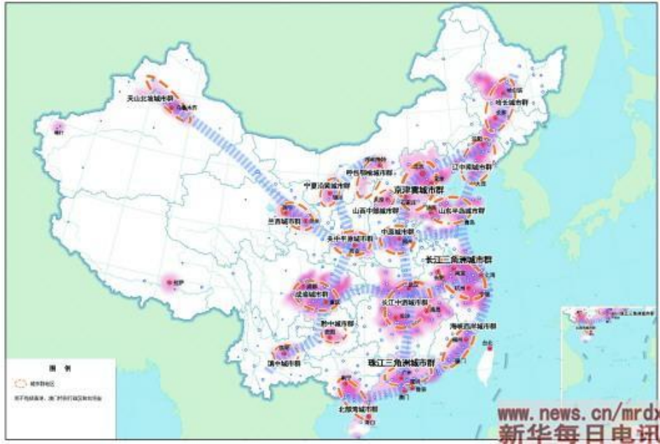
รูปที่ 3 ผังการพัฒนากลุ่มเมืองใหม่ในอนาคต